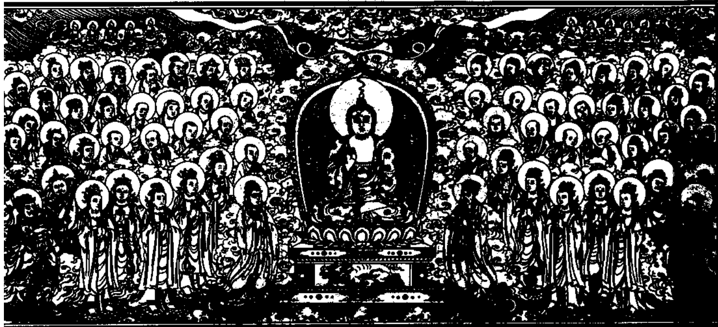
請刻龍藏佛說法變相圖