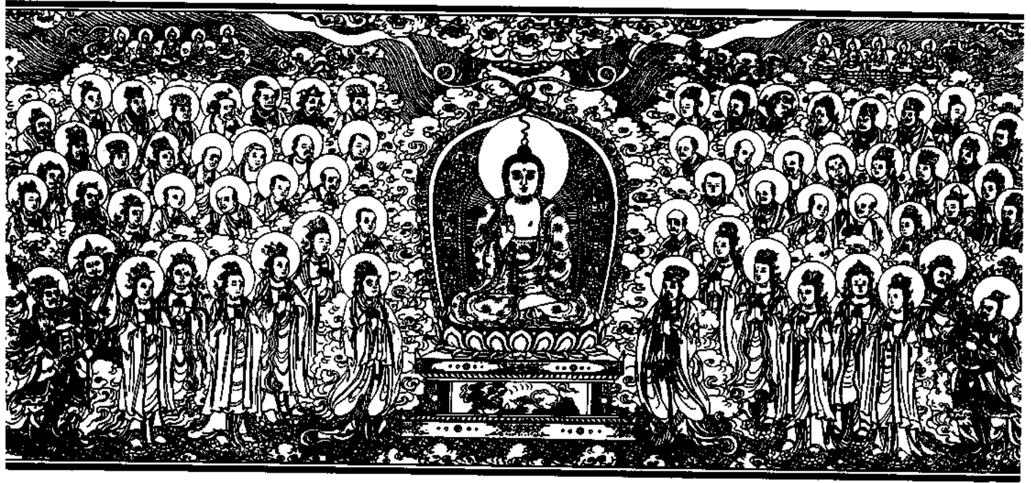
清刻龍藏佛說法變相圖