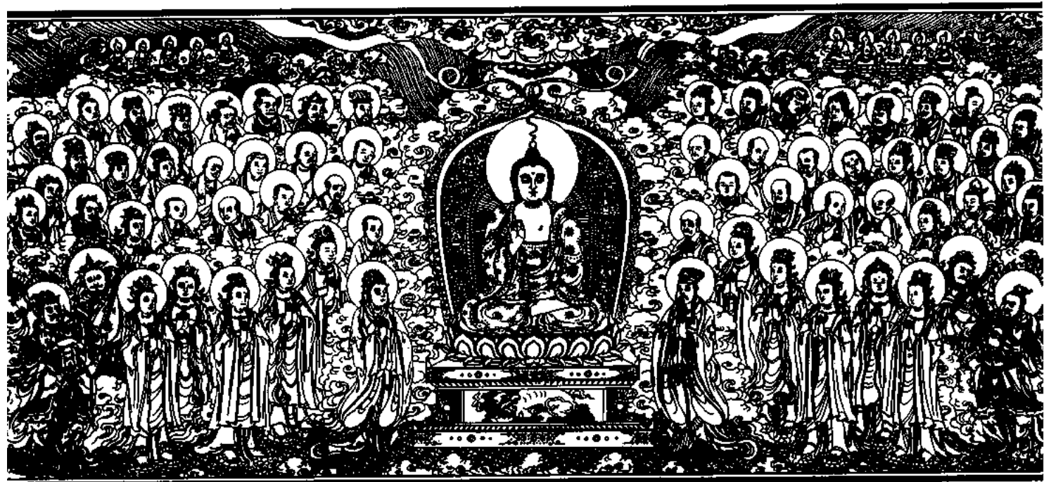
清刻龍藏佛說法變相圖