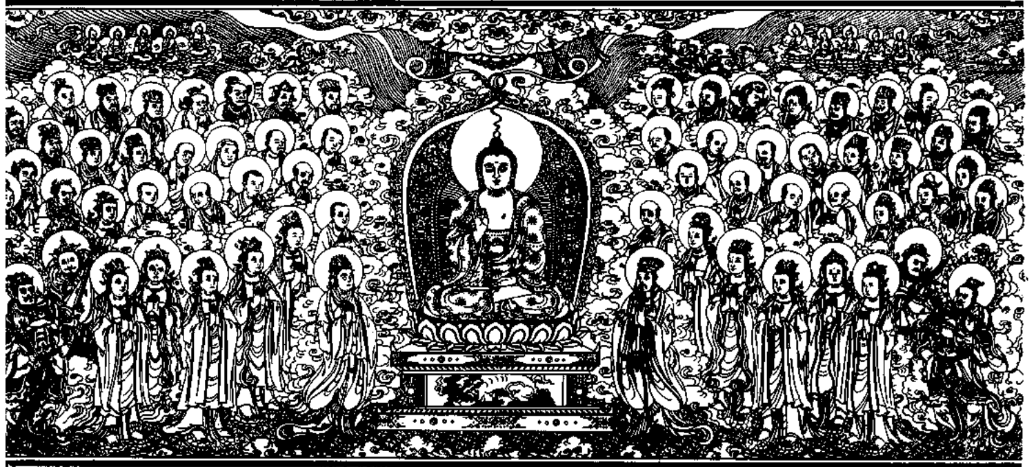
清刻龍藏佛說法變相圖