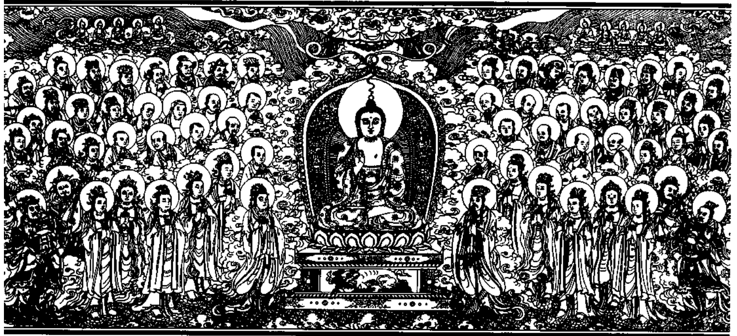
清刻龍藏佛說法變相圖